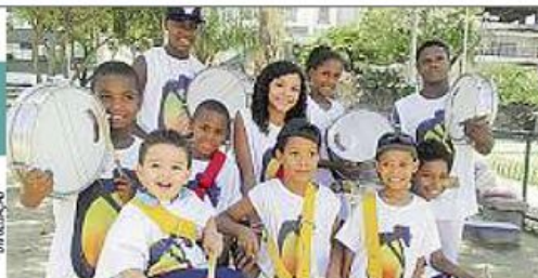
KIZOMBINHA . Integrantes do bloco participarão do show

> Grátis 'Viagem ao fundo do mar' . O evento apresenta espetáculos que são adaptações de clássicos da literatura inspirados no universo marítimo. Sex , "20 mil léguas submarinas". Sáb , "Moby Dick". Dom , "A arca dos bichos". BarnaShopping : Av. das Américas 4.666, Barra — 3089-1051. Qui a dom, às 18h. Livre. Até domingo.