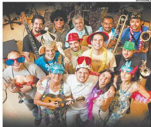
Banda da Fundação faz a festa e toca as marchinhas concorrentes

Logo depois, a banda da Fundação faz a festa. Relembra marchinhas campeãs em edições passadas do concurso